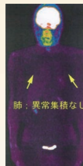
2005年11月 PET画像 両肺に異常集積なし

2005年11月にPETがん検診を受診。異常所見は認められなかった。2012年6月、PET-CT検診にて左肺上葉に径1.4cmの結節を認め、同日のPET-CT画像でFDG集積(SUV max=2.5)を伴う早期肺がんの診断。翌月手術を受け、切除標本による病理組織診断を実施したところ早期肺腺がん(ステージI)であった。