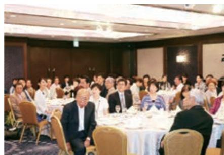
講演内容には健康長寿へのヒントがいっぱい。美味しくヘルシーなお料理も大人気。