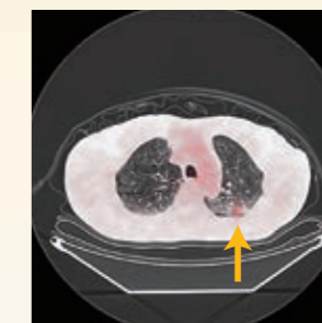
2012年6月 PET-CT画像 同部位にFDG集積を認める