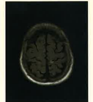
MRI検査 平成29年 同病巣が2年で痕跡化