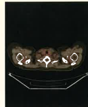
PET検査 平成28年 同病巣が1年で消失