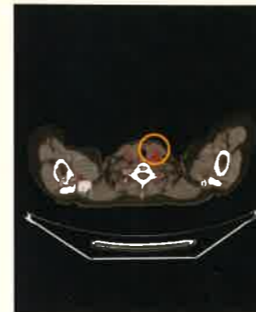
PET検査 平成27年4月 左頸部リンパ節転移巣

平成24年夏、脳転移を伴う径7cmの左乳がん、腋窩リンパ節転移。切除適応なく、化学療法および脳・放射線照射治療施行にて縮小傾向を認めた。平成25年4月、西台クリニック受診。化学療法に加えて食事療法を指導し併用で経過観察。平成27年4月、径2cmの左頸部リンパ節再発出現。マイルドな化学療法と共に、徹底した食事療法を継続して、本年2月、寛解(治癒)状態となる。