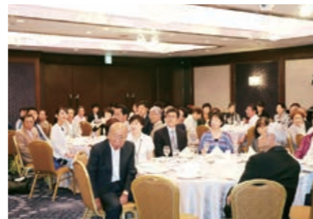
講演内容には健康長寿へのヒントがいっぱい。美味しくヘルシーなお料理も大人気。